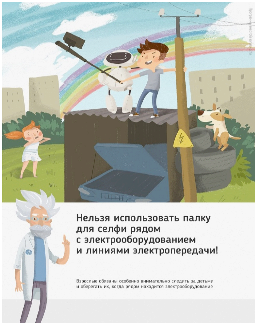
Рис 2. Нельзя использовать палку для селфи рядом с электрооборудованием и линиями электропередачи

Ну и, наконец, нужно повторить с ребенком алгоритм действий в экстремальной ситуации. Проверьте, умеет ли он набирать на сотовом телефоне телефон экстренных служб. Изучите с ним вещества и предметы, которые хорошо проводят электрический ток и потому особенно опасны, и, наоборот, вещества и предметы, плохо проводящие электрический ток и полезные в экстремальной ситуации.