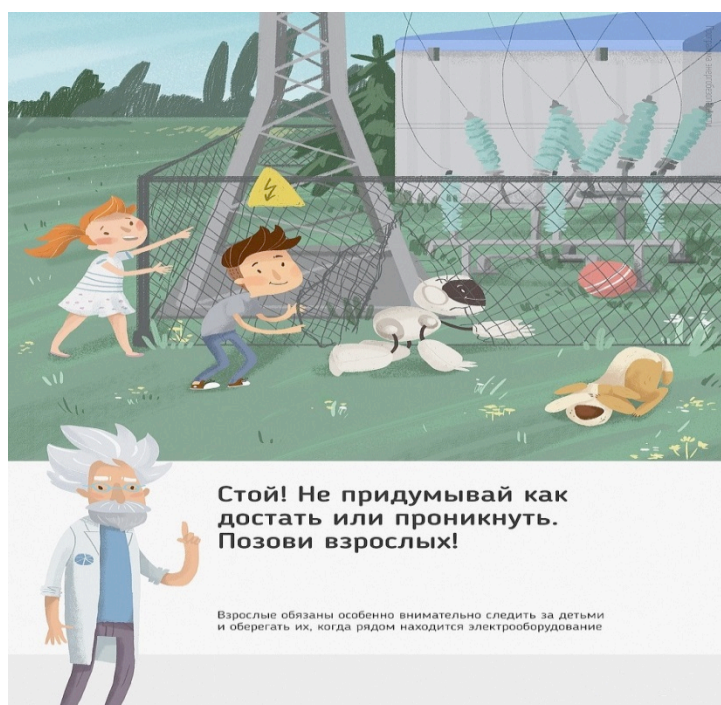
Рис. 5 Стой! Не придумывай как достать или проникнуть. Позови взрослых!