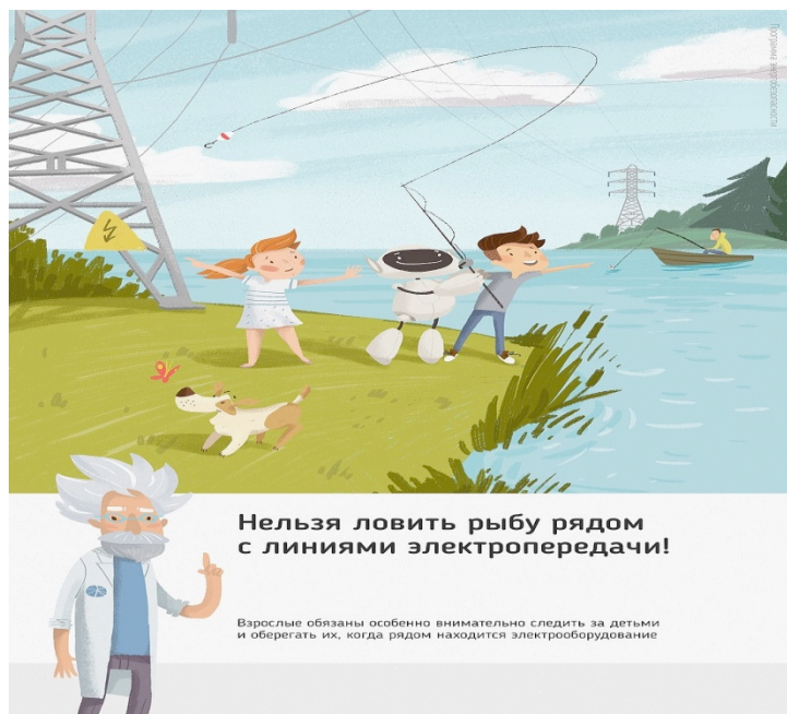
Рис. 4 Нельзя ловить рыбу рядом с линиями электропередачи

Об открытых подстанциях, оборванных проводах нужно сообщить в Кубанское ПМЭС по телефону 8-861-219-40-20 или позвонить на единый телефон всех экстренных служб 112.